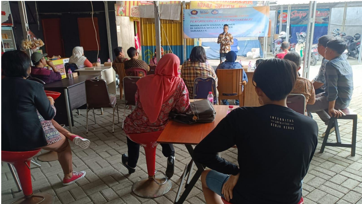
Pembukaan oleh Dosen STIE YAPAN