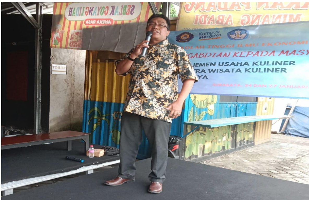
Pemateri oleh Dosen STIE YAPAN