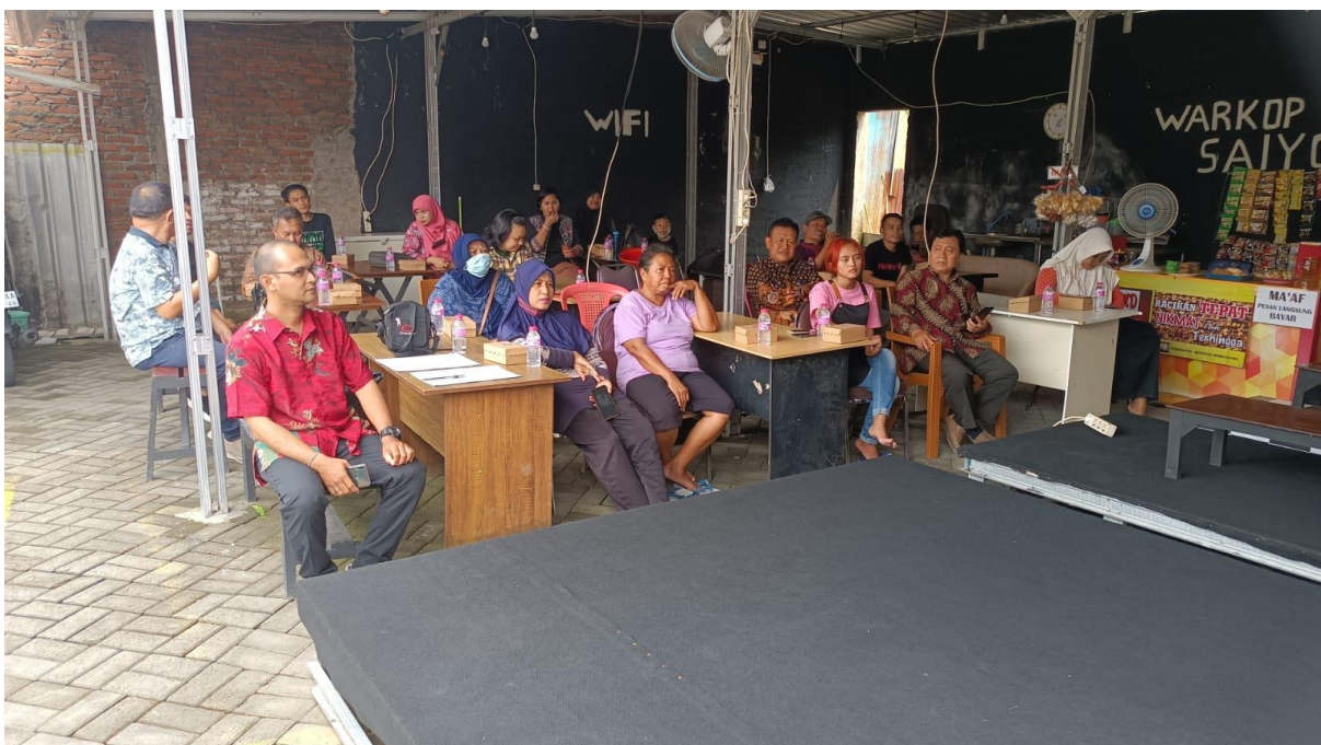
Pedagang Kuliner dan Dosen STIE YAPAN