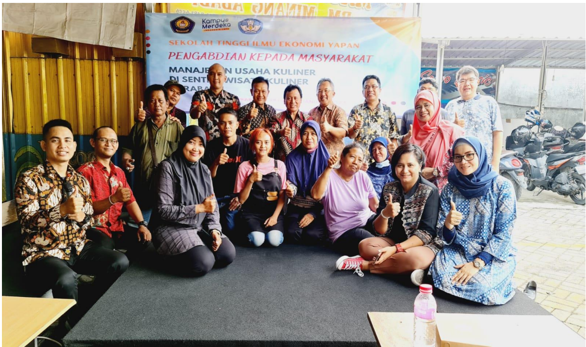
Foto Bersama: Dosen STIE YAPAN, Koordinator Pedagang Kuliner, dan para Pedagang Kuliner