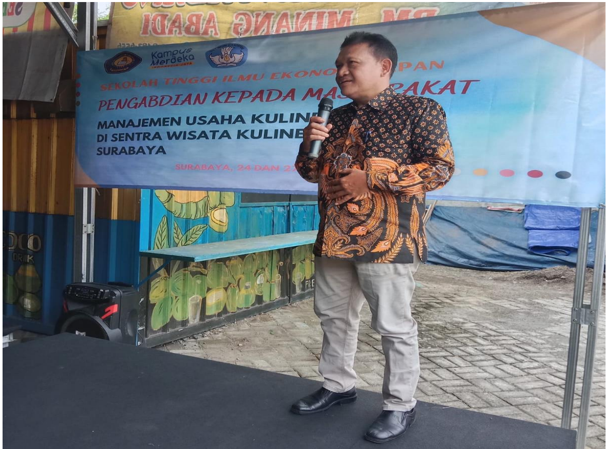
Pemateri oleh Dosen STIE YAPAN