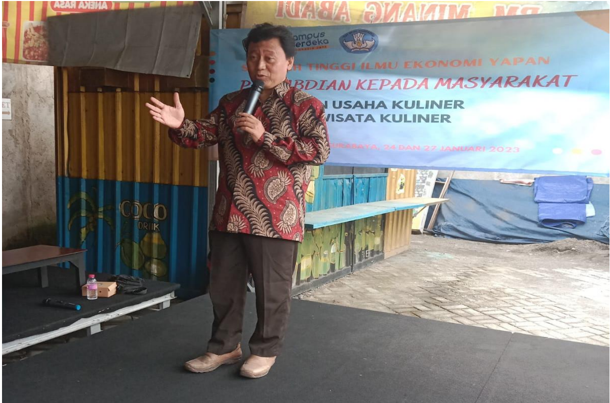
Pemateri dan Doa oleh Dosen STIE YAPAN